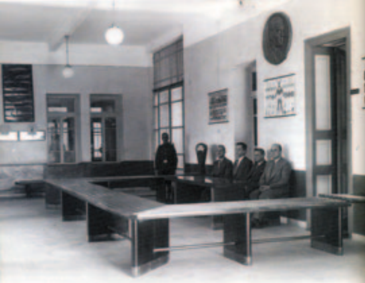
30'lu yıllarda İzmir yolcu salonu.. muayene ve muhafaza memurları görev başında, hizmete hazır.