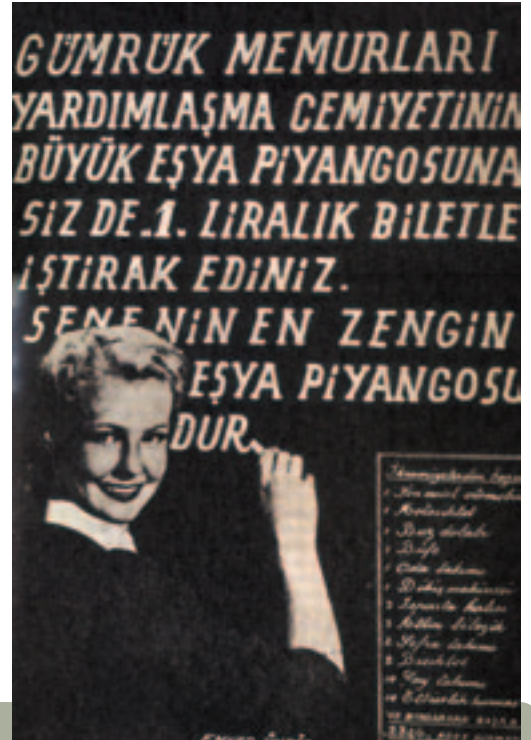
40'lı yıllardaki bu ilan ise, Gümrük Memurları Yardımlaşma Derneğinin çalışanlarına destek amacıyla düzenlediği bir piyangoyu, yani gümrük çalışanlarının birbiri ile olan dayanışmasını gösterir.